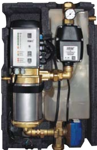
Binnenwerk van de IRM ® -3 -Rainmanager RME