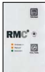
Bedieningspanelen RME en RMC